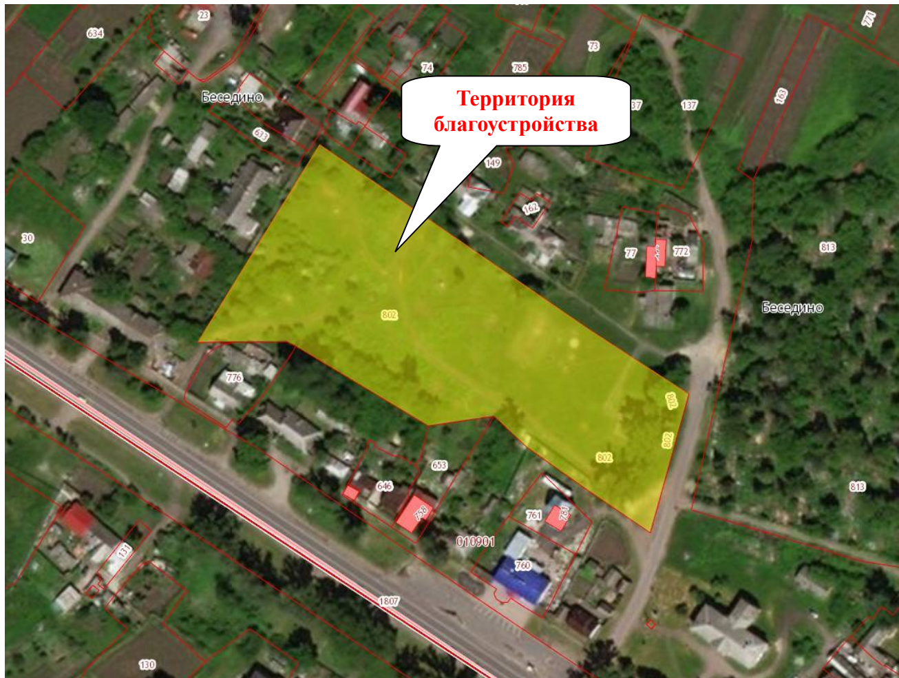
Рис.1. Общий вид территории благоустройства.

собственности муниципального образования «Бесединский сельсовет» Курского района Курской области. Площадь территории благоустройства составляет 14 800 кв.м. и находится в центральной части села. Градостроительная особенность территории благоустройства состоит в том, что он находится, в общественно-деловой зоне, вокруг земельного участка находятся индивидуальная жилая застройка.