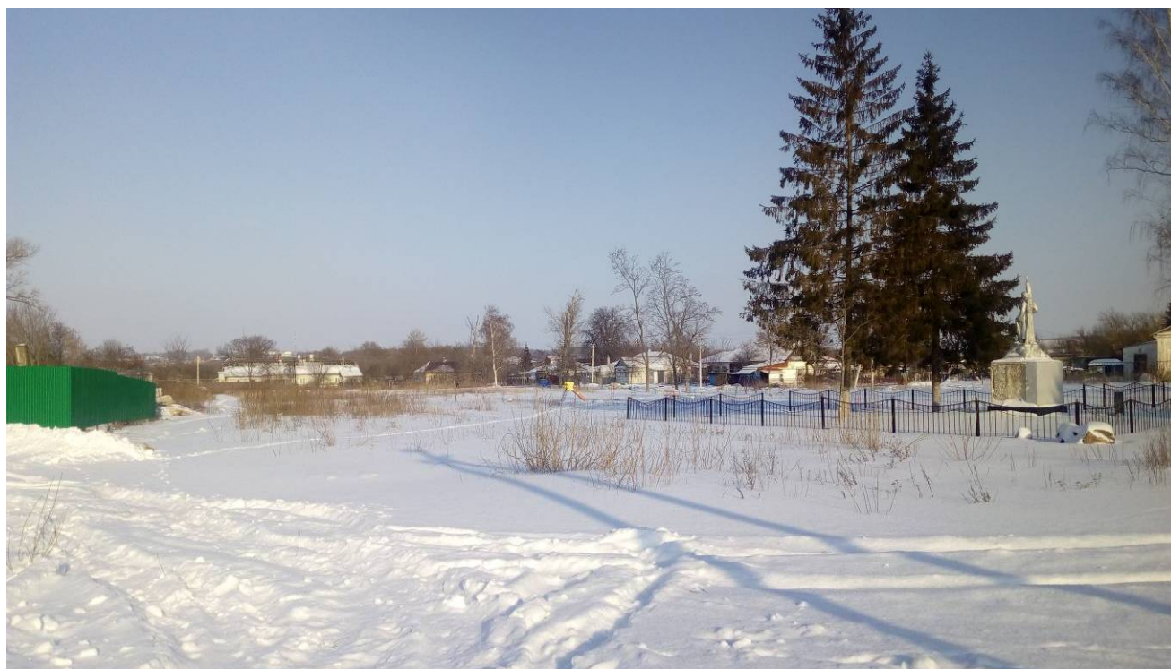
Рис.2. Состояние территории благоустройства.

На сегодняшний день территория благоустройства имеет неудовлетворительное состояние.